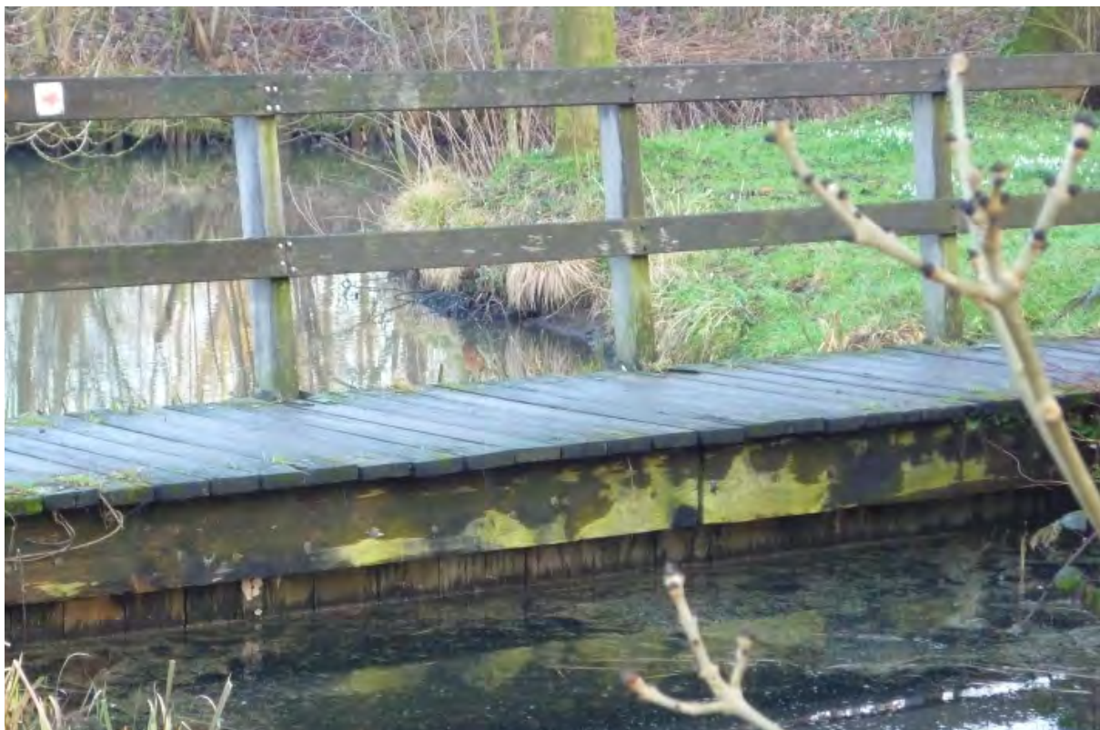
Stuw onder brug nabij Biltse Griff

Voor de argeloze wandelaar lijkt het water binnen Bloeyendael in verbinding te staan met de Biltse Griff. Tijdens de aanleg van het park in 1975 tot het voorjaar 1976 was dat voor een paar sloten wel het geval. Onder meer vanwege de slechte waterkwaliteit van het Biltsegrift-