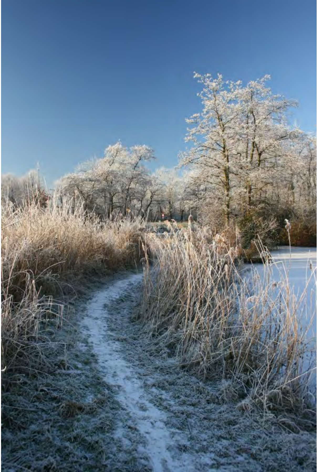
pad langs rietkraag bij waterlelievijver