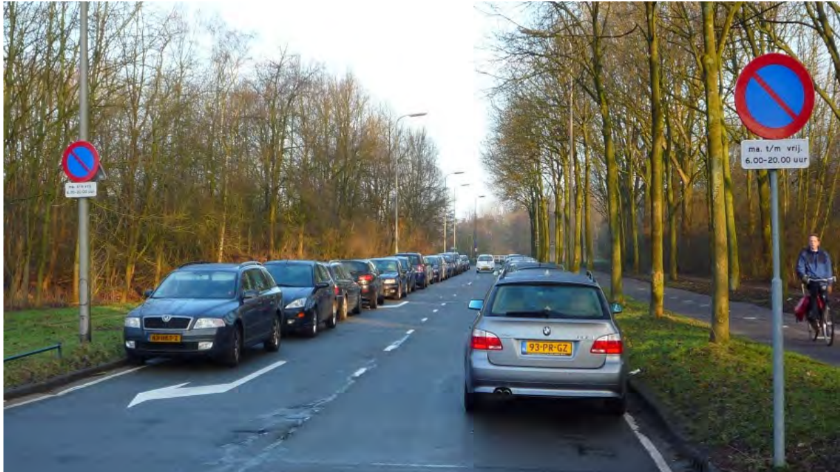
Archimedeslaan tijdens kantooruren

is oorspronkelijk ingesteld vanwege busvervoer naar de kantoren. Wegens gebrek aan belangstelling is deze busdienst vervallen. Het parkeren wordt sedertdien gedoogd onder de verbodsborden en aan beide zijden van de weg staan de auto's meestal bumper aan bumper geparkeerd. Merkwaardig, want voor een incidentele bus of vrachtwagen is dan onvoldoende