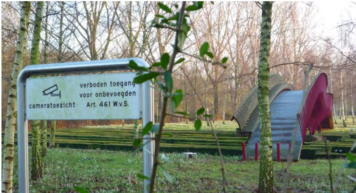
Fortistuin straks wel toegankelijk?

is dat het natuurlijke karakter van de tuin en de openbare toegankelijkheid behouden blijven. Dit aanbod hopen we binnenkort ook met de nieuwe eigenaar te bespreken.