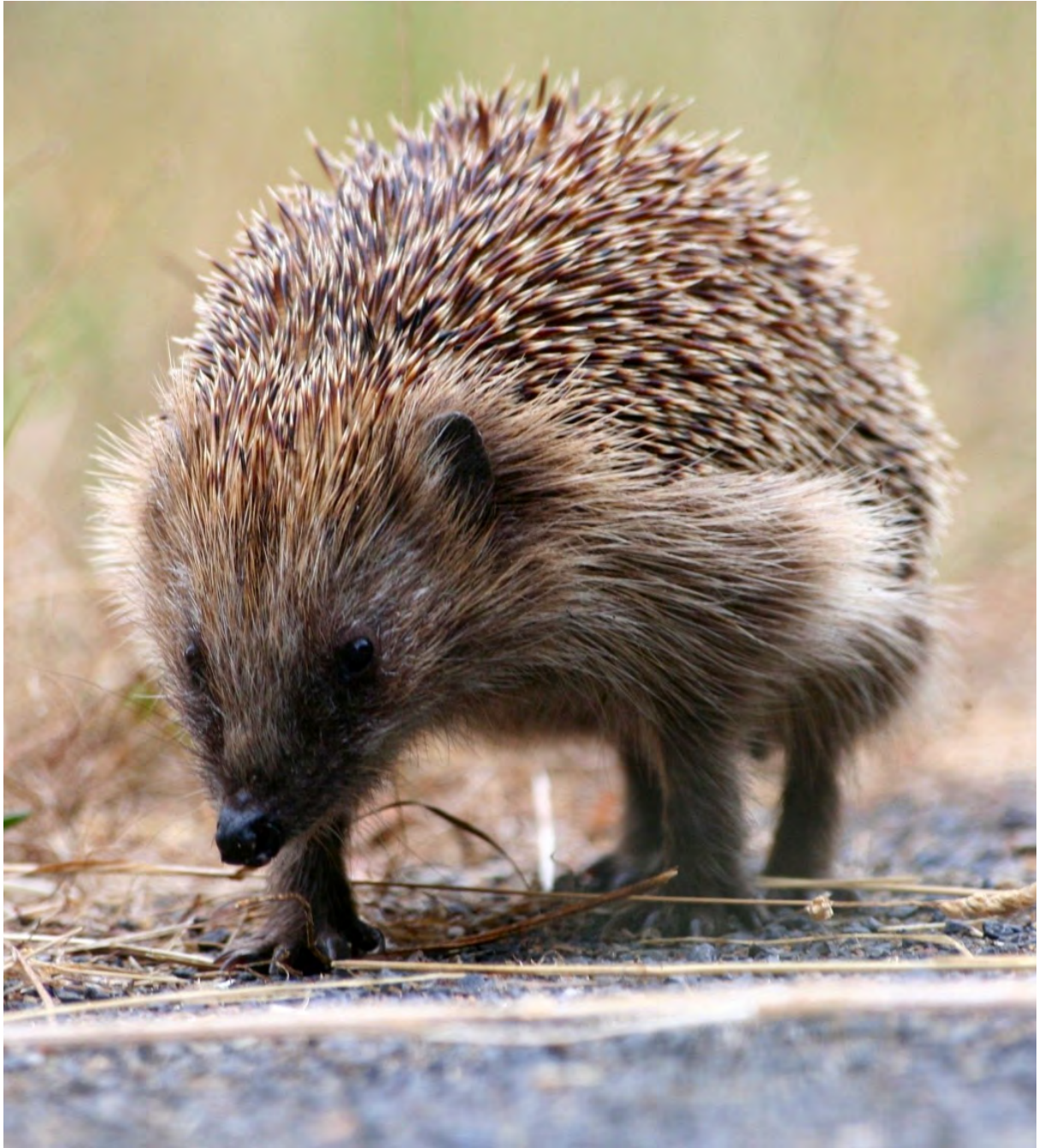
wandelen in Bloeyendael