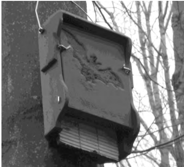
Een van de vleermuiskasten

De oplettende wandelaar zal het zijn opgevallen dat er in de loop van 2011 plotseling een aantal zwarte en in vorm afwijkende nestkasten opdoken in het noordelijk deel van park, het deel naast de Biltsestraatweg. Ook het bestuur was verrast. Het blijkt te gaan om in totaal 17 vleermuiskasten, die in opdracht van de gemeente zijn opgehangen. Na overleg met de projectleider is besloten, dat een aantal vleermuiskasten zal worden verwijderd en op een nieuwe geschiktere plek in het park worden opgehangen. Om zoveel mogelijk schade aan de gebruikte bomen in de toekomst te voorkomen, zal waar mogelijk de toegepaste ophanging (nu aluminium) van de vleermuiskasten worden vervangen door een rvs-ophanging. (Anton Hauser en Theo de Ronde)