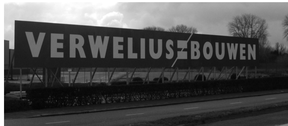
Verwelius kan hier voorlopig niet aan de slag

algemeen bekend dat projectontwikkelaars graag gebruik maken van middeleeuwse termen en zelden in staat zijn iets origineels te bedenken. Daarom zullen wij onze diensten aanbieden, waarbij we de naam 'Hessingstaete' maar even niet meer laten vallen. U begrijpt dat wij de nieuwe plannen met het terrein nauwgezet zullen volgen. (TR)