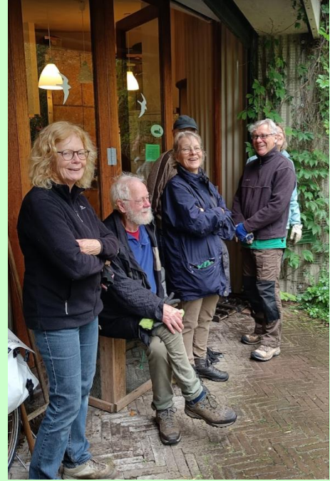
Wachten tot de bui voorbij is

Deze maand start de gemeente met het vellen en snoeien van een aantal bomen langs de Kromme Rijn, achter het ASR gebouw. Het gebied wordt enkele weken afgesloten.