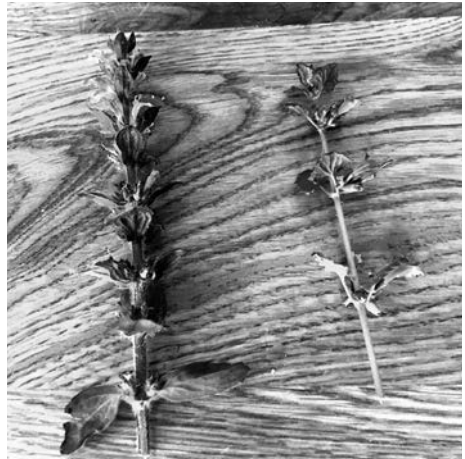
Linkskruipend zenegroen, rechts hondsdraf